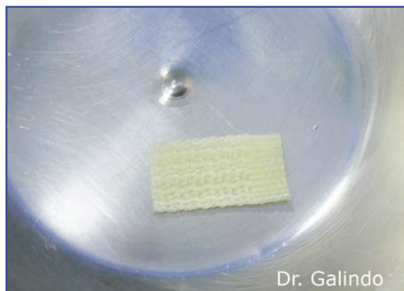
Figura 4. Artelon®. Small Bone Innovations, SBI.

El implante utilizado como espaciador en los estadios mas avanzados es el Artelon® (Small Bone Innovations, Inc) (10) .