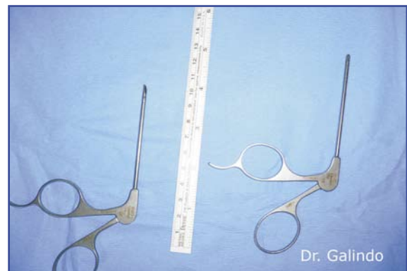
Figuras 1-3. Instrumental quirúrgico.