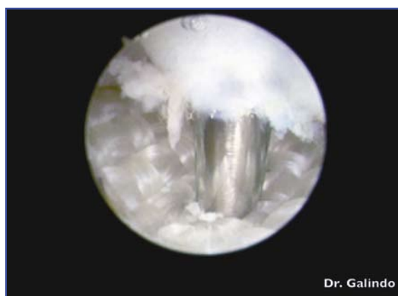
Figuras 8 y 9. Resección de cartilago y hueso subcondral del trapecio.