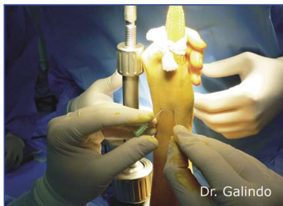
Figura 5. Localización de la articulación trapecio-metacarpiana.

Al ser una articulación tan poco constreñida, la estabilidad la confieren los ligamentos trapecio-metacarpianos. Existen un total de 16