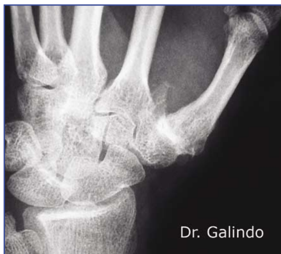
Figura 12. Rizartrosis de grado IV. Imagen prequirúrgica.

La inserción de la aguja de Kirschner debe hacerse bajo control radiológico y artroscópico, verificando que realmente la aguja estabiliza el Artelon® (Figuras 12-14).