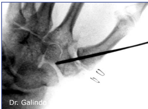
Figuras 13 y 14. Imágenes postquirúrgicas.

mer dedo y la muñeca. La inmovilización con una ortesis es suficiente y permite un mejor aseo, además de evitar complicaciones de tipo compresivo.