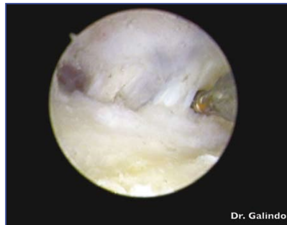
Figura 7. Retracción térmica de ligamentos volares con terminal específico de radiofrecuencia.

retracción sobre los ligamentos, para estabilizar la articulación y evitar la subluxación dorsal y el avance de la artrosis (Figura 7). Culp y Rekant publicaron un 90% de éxito con este tratamiento (19) .