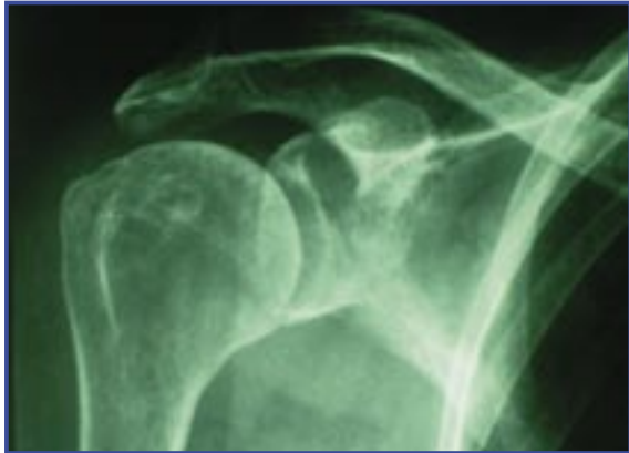
Figura 1. Rx simple.