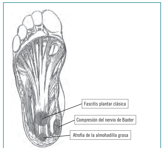
Figura 2. Localización de puntos dolorosos en paciente con talalgia (y causas habituales). Figure 2. Common locations of tenderness in patients with plantar heel pain (and their usual causes).

Estudio transversal de una cohorte de 40 pacientes inicialmente diagnosticados de fascitis plantar en nuestra área de referencia (hospitales de tercer nivel y centro de especialidades). Los criterios de inclusión de este estudio fueron: unilateralidad (si bien hasta en un tercio de casos es un proceso bilateral, debiendo descartar en estos casos una posible artritis seronegativa de base), ausencia de artropatía