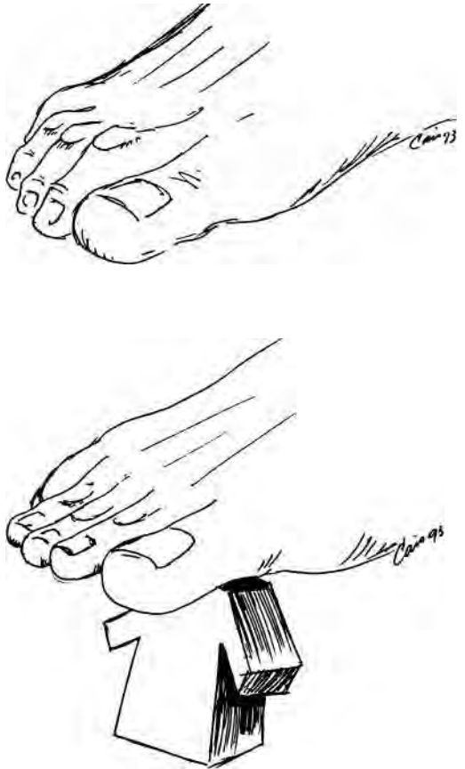
Fig. 1. Maniobra de Kelikian.

El patrón de flexibilidad fue determinado por la maniobra de KELIKIAN, donde la corrección de la deformidad es obtenida con la elevación de las cabezas metatarsianas, en posición de reposo. (Fig. 1).