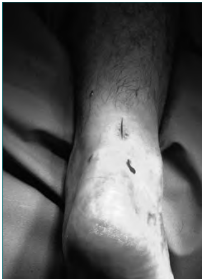
Figura 3. Material quirúrgico. Aguja viuda curva larga n.º 2 (Braun Aesculap, Tutlingen, Alemania, Ref. B100R). PDS II-1 (Polidioxanona, Ethicon, Johnson & Johnson Int., Bruselas, Bélgica).

Figure 2. Incisions for percutaneous repair.