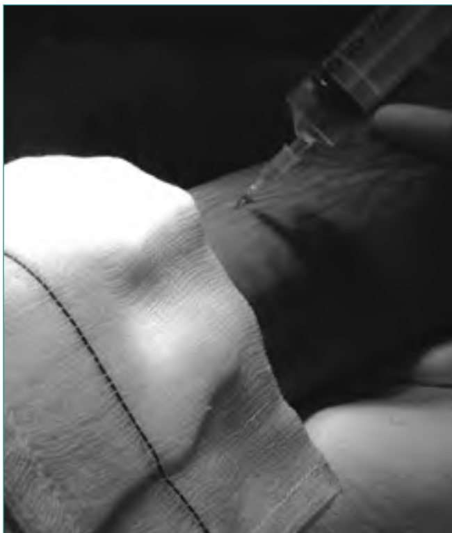
Figura 1. Anestesia local. Mediante la inclinación de la aguja en la región externa del tendón de Aquiles se localiza el nervio sural para determinar la "zona de seguridad" para la sutura.

Figure 1. Local anesthesia. Tilting of the needle in the lateral region of the Achilles tendon allows for sural nerve identification and for the determination of the "security area" for suture placement.