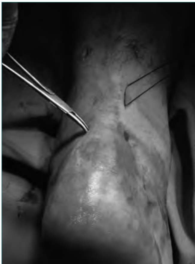
Figura 4. Utilizamos una pinza de hemostasia para liberar el tejido subcutáneo del peritendón.

Figure 4. A small haemostat is used to free the tendon sheath from the overlying subcutaneous tissue.