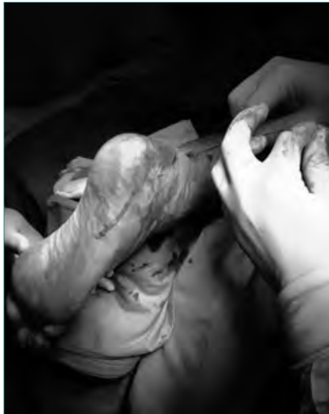
Figura 5. Se anuda la sutura con el tobillo en ligero equino, valorando la tensión según la movilidad activa intraoperatoria del paciente.

proximal ipsilateral. Se reintroduce la aguja con la sutura, atravesando el tendón en sentido perpendicular a sus fibras, hasta salir por la incisión proximal contralateral. Repetimos los pasos con las incisiones distales para finalmente anudar el hilo y alojar el nudo junto al peritenon. En cada uno de los pasos descritos, prestamos especial atención a la disección roma alrededor de las incisiones para que el hilo de la sutura se apoye en el peritenon y no provoque la formación de hoyuelos en el tejido subcutáneo y en la piel ( Figura 4 ). Estas depresiones son poco estéticas y pueden favorecer la formación de adherencias peritendinosas. Suturamos el peritenon con Vicryl de 3/0 (Ethicon, Johnson & Johnson Int., Bélgica). Antes de la sutura de la piel, aprovechamos la colaboración del paciente (gracias a la anestesia local) para pedir que mueva el tobillo activamente en flexión plantar y en flexión dorsal ( Figura 5 ). Esta prueba intraoperatoria de arco de movilidad nos parece muy importante, pues nos permite corroborar la tensión correcta de la sutura y su resistencia a la movilidad activa, fundamental para iniciar un tratamiento