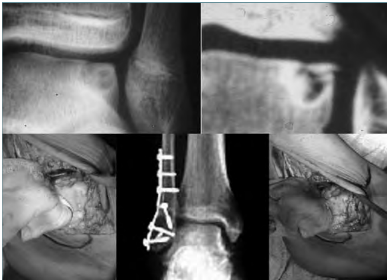
Figura 4. Lesión osteocondral parcial externa. Mosaicoplastia. Figure 4. Partial external osteochondral lesion. Mosaic-plasty.

de efectuar el tiempo óseo. Hay que ser cuidadosos con la sindesmosis.