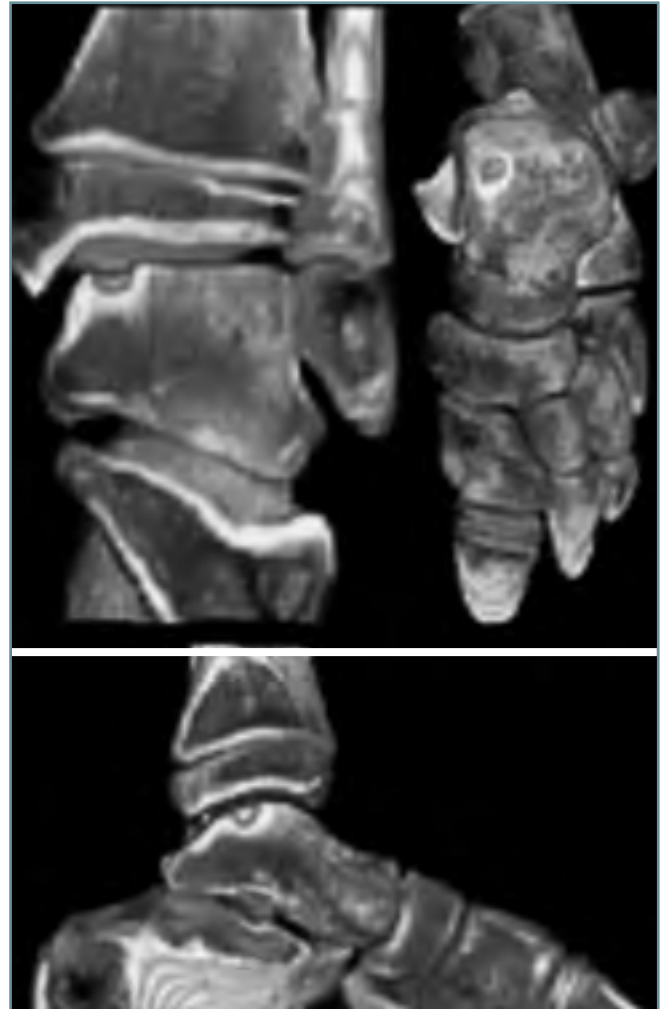
Figura 3. Imágenes tridimensionales por TAC helicoidal cedidas por el Dr. Núñez-Samper. Figure 3. 3-D helical CT scan images, by courtesy of Dr. Núñez-Samper.

Actualmente la artroscopia es una técnica importante en el diagnóstico y tratamiento de la osteocondritis. Las ventajas que ofrece son una buena visualización de la lesión, menor morbilidad, menos días de hospitalización y una recuperación más rápida de la movilidad del tobillo. Ahora bien, para tratar las osteocondritis por artroscopia es fundamental que el cirujano posea una experiencia importante en la artroscopia del tobillo.