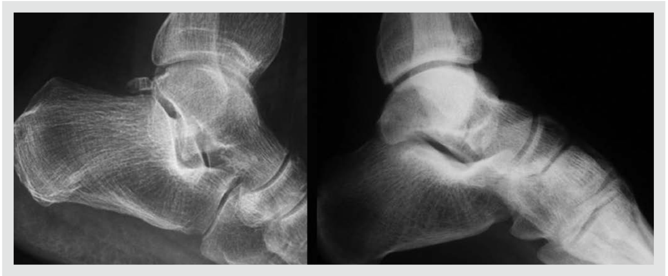
Figura 1. Visualización de la forma de “V itálica” simétrica de la apófisis lateral y “signo de la V positiva” en un caso de fractura.

dorsiflexión, un 80% de rotación externa y un 45% de eversión.