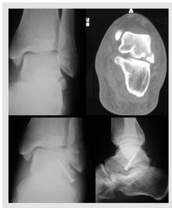
Figura 2. Radiografía y tomografía computarizada de fractura de la apófisis lateral del astrágalo y radiografías postoperatorias de la osteosíntesis realizada.

Clínicamente presentan dolor en la zona medial del mesopié, inmediatamente distal y anterior al maléolo