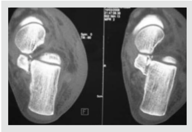
Figura 3. Imagen de tomografía computarizada de fractura de sustentaculum tali .