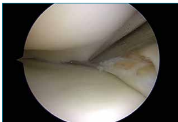
Figura 3. Reducción de una rotura en asa de cubo.

Las roturas de menos de 10 mm de largo pueden dejarse sin reparar porque tienen un buen potencial de curación (9,12) .