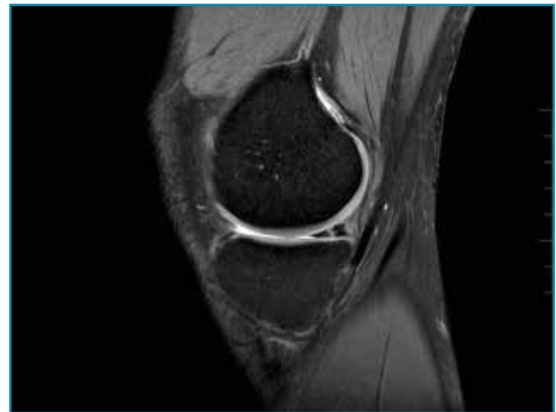
Figura 2. Imagen de rotura vertical en el cuerno posterior del menisco interno.

mentación de las mismas, así como contar con una clasificación fiable y reproducible. Esto permitiría reducir los sesgos de medición de las lesiones meniscales y mejorar la validez de los resultados, tanto del tratamiento como en la composición de los ensayos clínicos al respecto. Con este propósito, la Sociedad Internacional de Artroscopia, Cirugía de Rodilla y Medicina Deportiva (ISAKOS) ha desarrollado una clasificación que mide las siguientes variables: profundidad de la lesión, localización en el espesor del menisco (según zonas siguiendo la irrigación meniscal), localización radial (2 tipos: A y B), compromiso o no del hiato poplíteo (en el menisco externo), patrón de la lesión, calidad del tejido, longitud de la lesión y porcentaje extraído del menisco (7) ( Tabla 1 ).