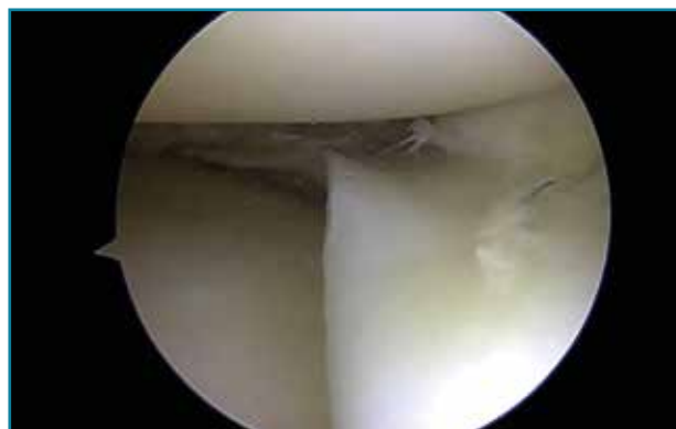
Figura 4. Asa de cubo: sutura con 3 puntos mediante técnica todo dentro.