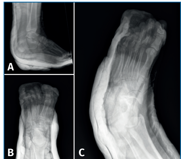
Figura 2. Radiografía lateral de tobillo (A) y anteroposterior (B) y oblicua (C) de pie tras reducción cerrada e inmovilización con yeso.

Se realizaron radiografías anteroposterior (AP) y lateral del tobillo, y AP y oblicua del pie, donde se diagnostica de luxación peritalar medial abierta ( Figura 1 ).