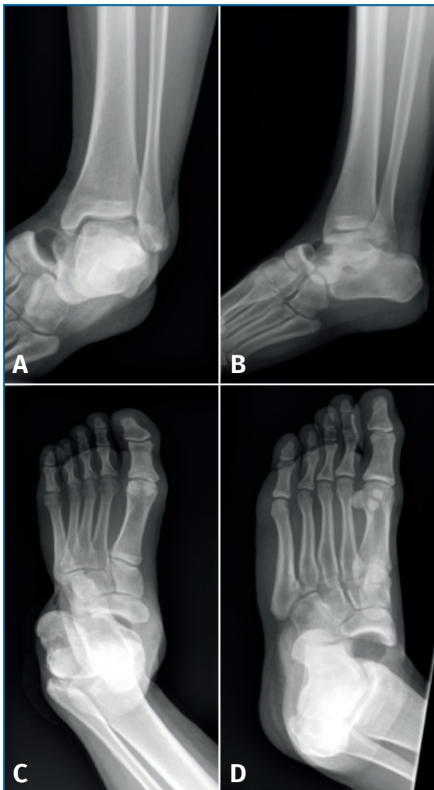
Figura 1. Radiografía anteroposterior (A) y lateral de tobillo (B). Radiografía anteroposterior (C) y oblicua (D) de pie con hallazgo de luxación periastragalina medial.

sangrado en sábana y deformidad en “pie zambo adquirido”. Presenta dolor intenso a la palpación. Movilidad distal y exploración neurovascular distal conservadas.