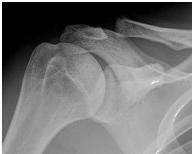
Figura 2 – Radiografía anteroposterior de hombro derecho con una osteolisis del extremo distal de la clavícula. Obsérvese la rarefacción irregular del borde lateral de la clavícula. Ocasionalmente pueden observarse calcificaciones punteadas en la zona osteolítica.

En la exploración, se observa inflamación articular y dolor con la aducción forzada del hombro y con los últimos grados de flexión anterior forzada del hombro. Se debe descartar la existencia de inestabilidad acromioclavicular, que puede tener implicaciones terapéuticas. La infiltración anestésica de la articulación puede ser útil en el diagnóstico 16 .