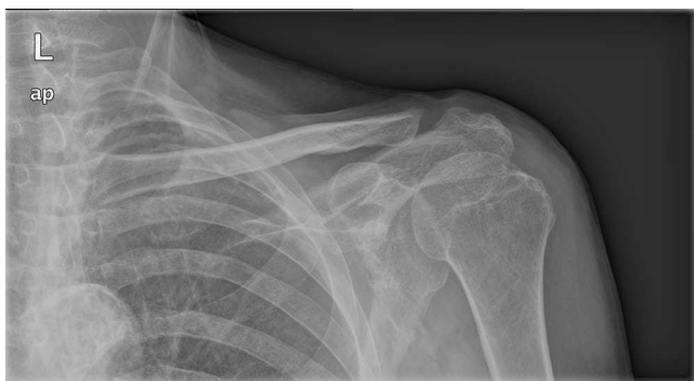
Figura 3 – Radiografía anteroposterior de hombro izquierdo con artrosis acromioclavicular de hombro izquierdo tratada mediante resección artroscópica. La resección ideal es controvertida pero debe permitir un movimiento de la articulación acromioclavicular sin pinzamiento residual.