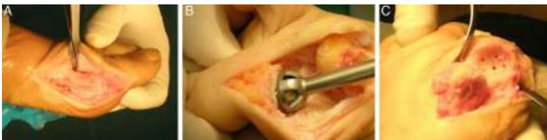
Figura 1 A) Incisión medial. B) Fresado cóncavo-convexo. C) Perforaciones.

A los 4 meses de la cirugía, un 84,44% de los pacientes estaban muy satisfechos y un 15,6% satisfechos. Ningún paciente descontento con el resultado final de la intervención.