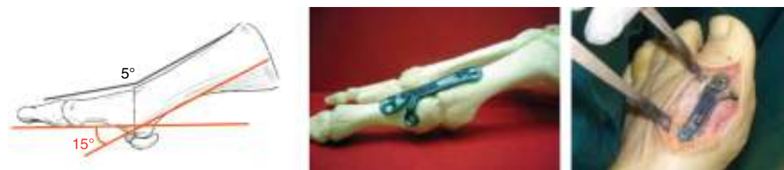
Figura 2 Técnica quirúrgica.

Con control postoperatorio a los 10 días (curas), a las 4, 8, 12, 16 semanas, a los 6 meses y al año posquirúrgica. Con un seguimiento mínimo de 12 semanas.