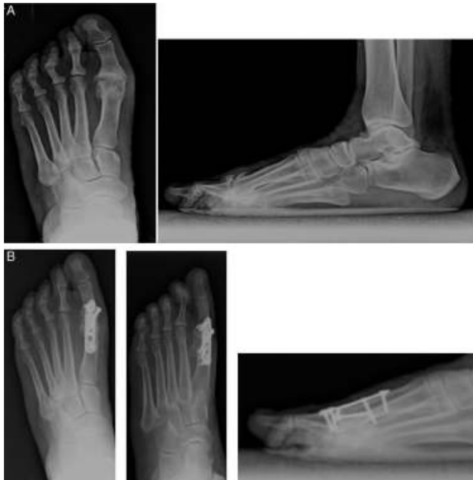
Figura 3 Caso clínico paciente grupo 2. A) Prequirúrgica. B) Cuatro meses posquirúrgica.

El manejo postoperatorio de estos pacientes está bastante discutido. Al inicio, se mantenía a los pacientes en descarga con un yeso un mínimo de 6-8 semanas para después iniciar deambulaci3n con un Walker o zapato ortopédico 19 . También es cierto que no se fijaban las artrodesis o los métodos de fijaci3n eran mucho menos estables que los actuales. Con el tiempo, estos sistemas de fijaci3n han ido mejorando y los cirujanos han modificado su conducta en el postoperatorio tolerando cargas antes desaconsejadas. Roukis et al. 20 , en su estudio retrospectivo, observaron que con carga inmediata con un zapato ortopédico especial obtenían una baja incidencia de no uni3n y una mejoría en la atrofia muscular y en el dolor articular que normalmente presentan los pacientes que han realizado descarga.