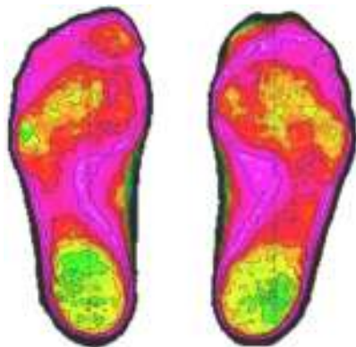
Figura 5 Distribución de cargas sin calzado, plano rígido a las 8 semanas postoperatorias comparativa con las 12 semanas postoperatorias (izquierda intervenida).

Los pacientes con zapato plano rígido se muestran más satisfechos y presentan menos comorbilidad, sin ser estas diferencias estadísticamente significativas. Una vez comparados un grupo retrospectivo y uno prospectivo, el siguiente