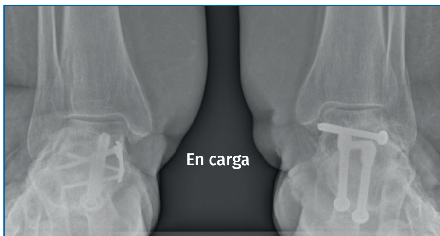
Figura 4. Casos de progresión a grado IV tras doble artrodesis bilateral a los 4 años de evolución sin técnica de Cotton asociada.

dual del antepié. Pensamos que la deformidad progresa por ausencia de corrección de esta supinación rígida del antepié, que obliga a forzar el valgo para conseguir el apoyo del primer radio después de la artrodesis del retropié. En nuestro estudio, en 20 pacientes (42,55%) hubo progresión de la deformidad al tipo IV, de los cuales 19 no tenían asociada osteotomía de Cotton (95%). La progresión fue precoz, en un tiempo medio de 2,5 años, más tardía, sin embargo, que la que refieren Miniaci-Coxhead et al. (14) , en 3,6 meses; en su estudio la progresión se da solo en el 27% de sus casos.