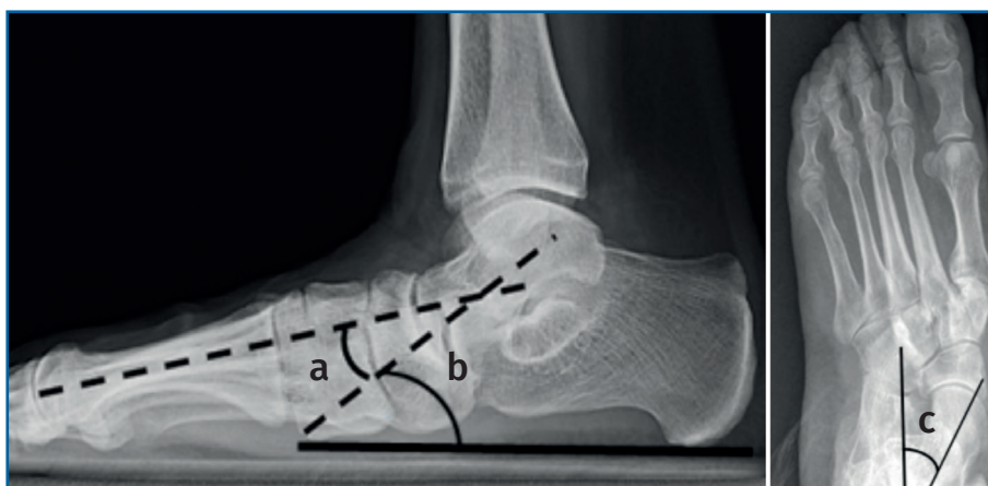
Figura 1. Ángulos valorados en radiografía en carga lateral y anteroposterior. a: ángulo de Meary; b: ángulo inclinación astragalina; c: ángulo talocalcáneo anterior.

Para estimar el seguimiento medio, se consideró el tiempo transcurrido entre la fecha de la intervención quirúrgica y la fecha de la última