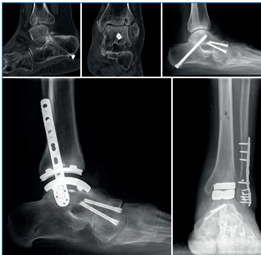
Figura 4. Progresión de un paciente intervenido de triple artrodesis donde se implanta una artroplastia total de tobillo TM Ankle® (Zimmer Biomet®).

la estabilidad tibiotalar y la existencia de un talar tilt en valgo > 10^\circ (26) . En pacientes previamente tratados con doble artrodesis, la ATT puede ofrecer excelentes resultados funcionales (Figura 4). Pueden presentarse varios escenarios: