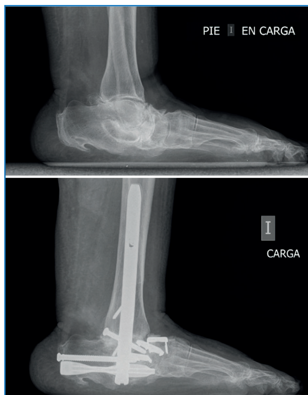
Figura 2. Artrodesis pantalar en pie plano-valgo con degeneración grave en el retropié y el calcáneo. La paciente acudió a consulta en silla de ruedas debido a la imposibilidad de caminar con apoyo sobre el pie afectado, presentando además debilidad secundaria a la inactividad del miembro. Se optó por realizar una artrodesis pantalar con el objetivo de facilitar una recuperación más rápida mediante una única intervención quirúrgica.

La artrodesis pantalar consiste en la fusión combinada del tobillo y las articulaciones del retropié (subtalar, talonavicular y calcaneocuboidea) ( Figura 2 ). Las principales indicaciones incluyen artrosis multinivel, fracaso de cirugías previas –como artroplastia de tobillo o pseudoartrosis de artrodesis tibiotalar–, deformidades graves con