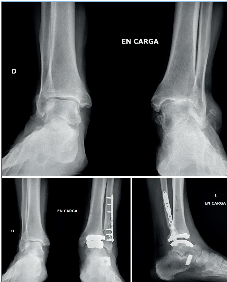
Figura 5. Paciente que debuta con una deformidad flexible y artrosis en valgo tibiotalar donde se realiza reconstrucción ligamentosa, osteotomía de alargamiento de la columna lateral con cuña de titanio poroso y posterior implante de artroplastia total de tobillo TM Ankle® (Zimmer Biomet®).