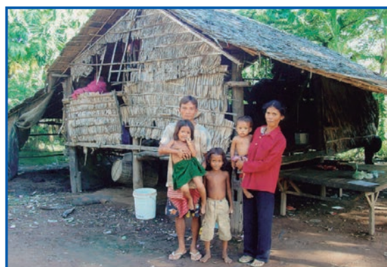
Figura 1. Familia en Kompong Thom. En el área rural la mayoría de la población vive en condiciones de pobreza extrema.

Tras el genocidio de los jemes rojos (1975-1979) y la ulterior invasión vietnamita (1979-1989), el sistema económico, político y social de Camboya quedó desestructurado. Ejemplo de ello resulta el precario sistema de salud que, a día de hoy, presenta evidentes carencias (4) . En el terreno de la cirugía ortopédica y la