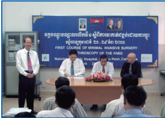
Figura 4. Inauguración del I curso teórico-práctico de artroscopia.

cometido de reclutar y centralizar a los pacientes, así como asumir el tratamiento postoperatorio.