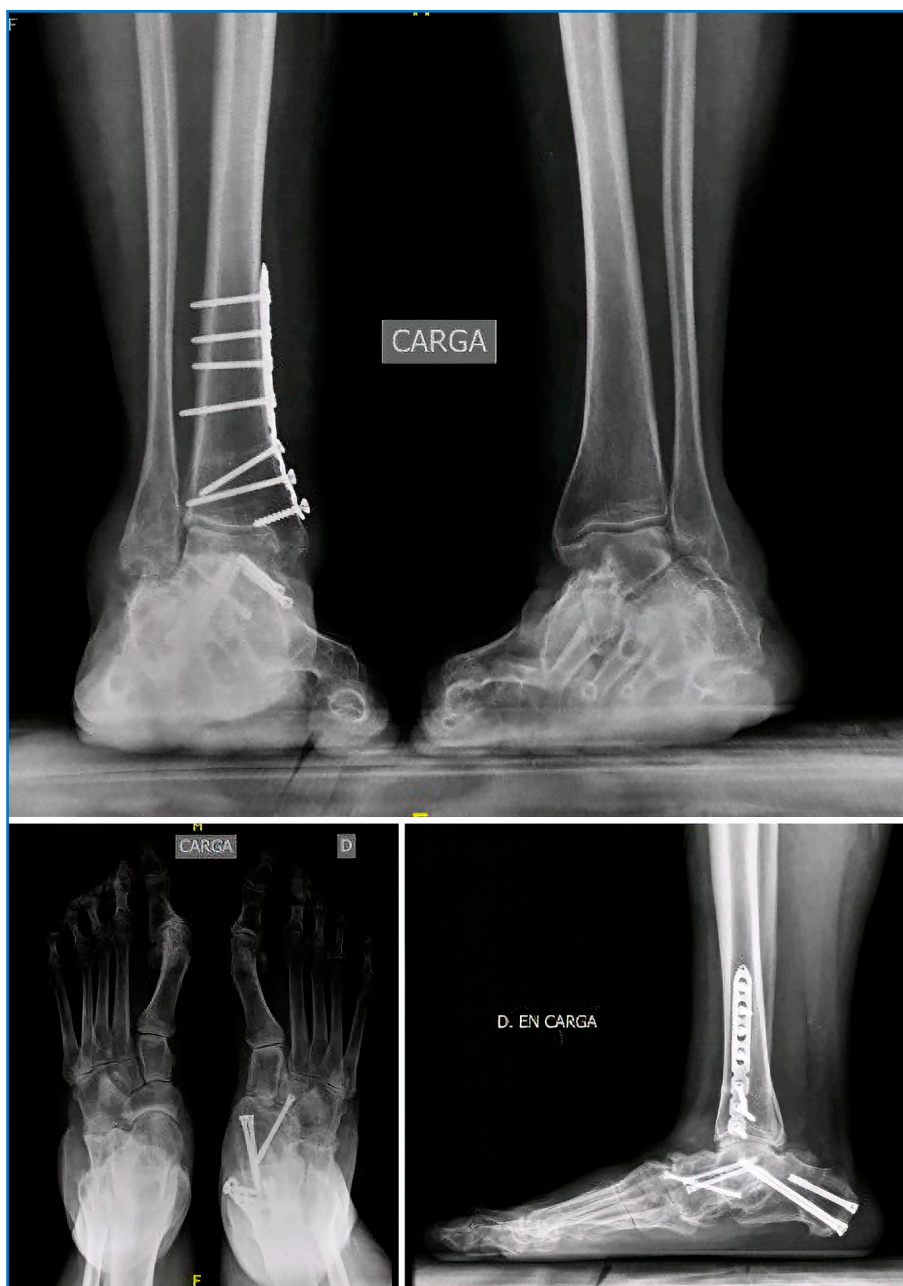
Figura 4. El abordaje quirúrgico consiste en una osteotomía supramaleolar de sustracción medial junto con una artrodesis subastragalina para controlar la posición del astrágalo sobre del calcáneo debido a la inestabilidad periastragalina, así como una artrodesis astragaloescafoidea que permite corregir el abducto y restaurar el ángulo de Meary.

la combinación de tornillos cruzados asociados a placa bloqueada medial o a grapas de compresión continua (21) .