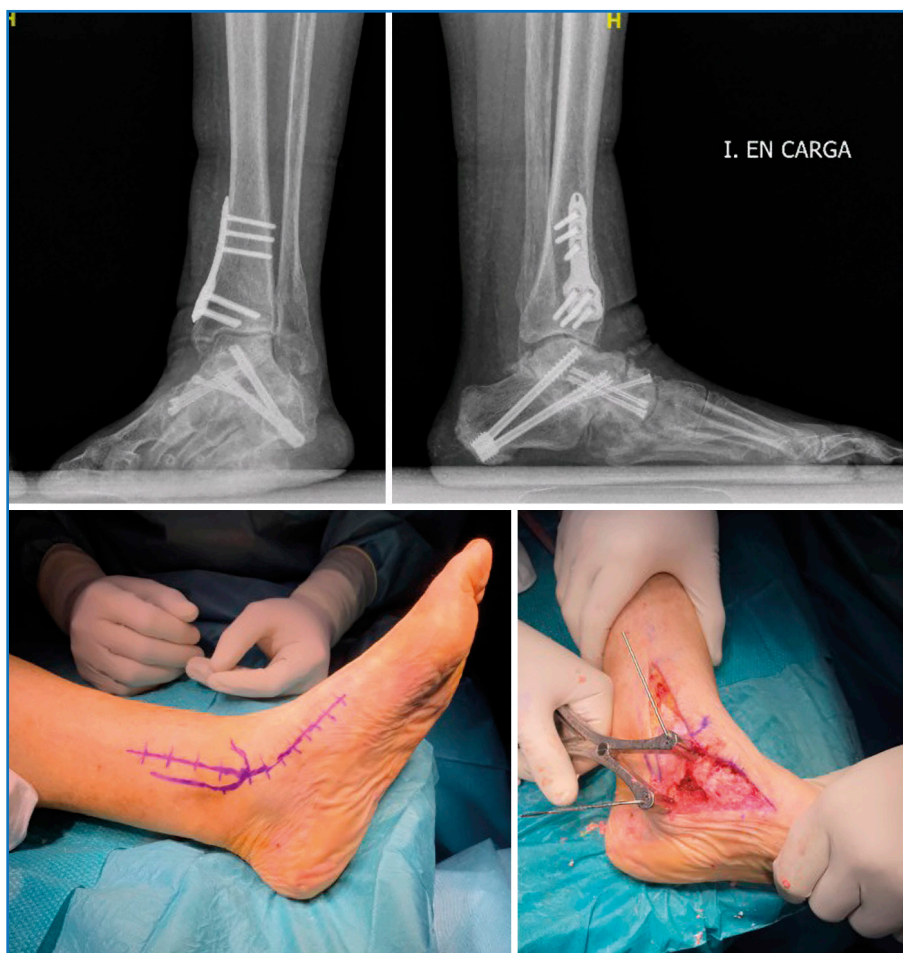
Figura 6. Para la pseudoartrosis se realizó una nueva artrodesis aportando injerto. Se entendió que la recidiva podía ser debida a una inestabilidad medial que había pasado desapercibida en un primer tiempo, así que se realizó un retensado del ligamento deltoideo con aumentación con banda elástica y una osteotomía supramaleolar varizante por vía medial ampliada (inferior) para cambiar el vector de fuerza y centrar las cargas en el astrágalo. La paciente se encuentra sin dolor al año (superior).

Aunque este no es el único factor predisponente. Tenemos que tener en cuenta también la abducción del mediopié aumentada, la excesiva rigidez del pie por confluencia de artrodesis, la presencia de un pinzamiento calcaneoperoneal y la insuficiencia del ligamento deltoideo.