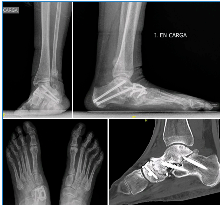
Figura 5. Paciente de 75 años intervenida en el pasado de una doble artrodesis por una deformidad colapsante progresiva del pie derecho. Al año postoperatorio inicia un cuadro de dolor en el tobillo con recidiva de la deformidad. Se observa un defecto de consolidación de la artrodesis y una fractura de estrés del peroné con un pinzamiento subperoneal.

El retraso en la consolidación ósea, la infección o problemas de herida (especialmente en el retropié lateral) son también eventos relevantes, asociados a factores como tabaquismo, diabetes y obesidad.