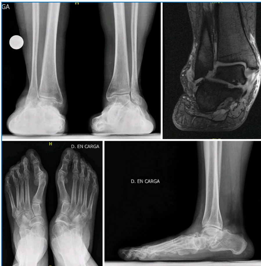
Figura 3. Mujer de 63 años que consulta por un pie plano rígido en el lado derecho con un dolor principalmente en la cara lateral del retropié, arco medial y tobillo. Se observa una descubertura astragaloescafoidea con artrosis, junto con un pinzamiento calcaneoperoneal por el valgo del retropié y una deformidad asimétrica en valgo del plafón tibial ligeramente incongruente con un astrágalo en Z en la resonancia magnética.