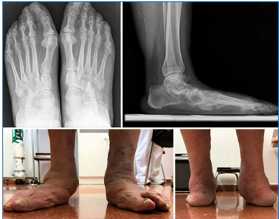
Figura 1. Deformidad irreductible en el lado derecho con un gran predominio del abducto y del valgo del retropié. Hay que remarcar la descubertura astragaloescafoidea y el realce artrósico de la articulación subastragalina.

Clásicamente, se aborda la articulación SA por un abordaje lateral al seno del tarso y la articulación AE por un abordaje dorsomedial, aunque está descrita la preparación de ambas superficies articulares por un abordaje medial único (11) con la intención de evitar las complicaciones de la herida lateral, con una tasa de unión comparable y predecible (12) ( Figuras 1 y 2 ). Una vez expuestas estas articulaciones, se cruentan sendas superfi-