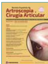
Imagen de portada