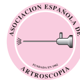
Imagen de portada