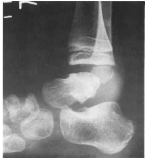
Fig. 2. Evolución a los 6 meses: necrosis del cuerpo del astrágalo.