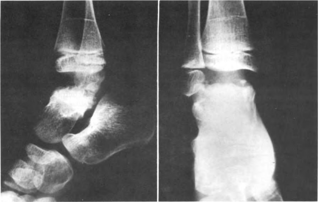
Fig. 3. Evolución al cabo de 1 año y 8 meses: necrosis del cuerpo del astrágalo.