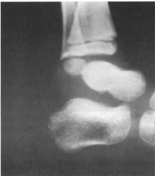
Fig. 1. b) Reducción incruenta.