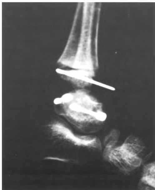
Fig. 6. Reducción quirúrgica.

Actualmente la resonancia nuclear magnética es el método de mayor especificidad para determinar y cuantificar las áreas necróticas.