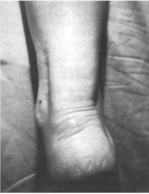
Fig. 1. Aspecto clínico de ambos Aquiles afectados de xantomas.

ción de la tasa de colesterol (585 mg/dl., n = 150-250 mg./dl.), de la fracción HDL (99 mg./dl., n = 35-50 mg./dl.) y sobre todo de la fracción LDL (463 mg./dl., n = 80-140 mg./dl.) con triglicéridos normales (76 mg./dl., n = 70-170 mg./dl.) y afectación de varios de los miembros de la familia (madre, hermana, hijo, sobrino) por lo que con el diagnóstico de Enfermedad Hipercolesterolemica Familiar se instauró tratamiento con Lovastatin.