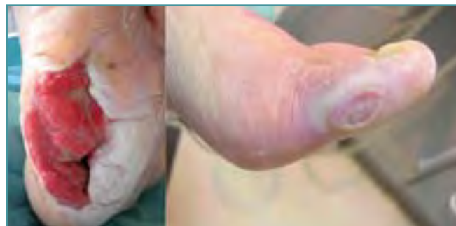
Figura 3. Úlcera neuropática plantar e isquémica en el 1.º dedo.

Después de la anamnesis y la exploración física, podremos catalogar el pie explorado en un “grado de complejidad”, que nos informa de forma rápida sobre qué controles y cuidados precisa el paciente (14) . Básicamente se diferencia el