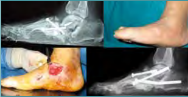
Figura 8. Recidiva de pie en balancín por fracaso de osteosíntesis. Reconstrucción con tornillos canulados de 6,5 mm.

Figure 8. Osteosynthesis failure and recurrence rocker foot. Reconstruction with 6.5 mm cannulated screw.