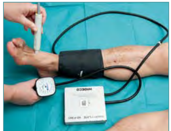
Figura 1. Exploración con Doppler para calcular el índice de tobillo-brazo.

El ITB es normal entre 0,9 y 1,1. Un ITB de 0,90 o menor sugiere enfermedad arterial periférica (isquemia crítica por debajo de 0,5), mientras que un ITB superior a 1,1 puede