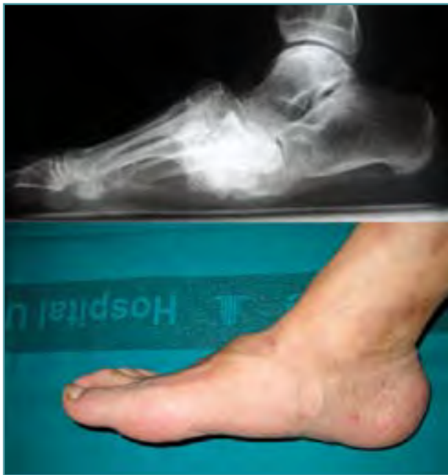
Figura 5. Pie en balancín por artropatía de Charcot.