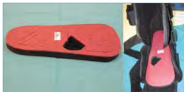
Figura 7. Descarga con plantilla y bota corta.

Suele realizarse el tratamiento hospitalizado y con el apoyo del equipo de medicina interna o de infecciosas. Además, será muy importante el buen control de la glicemia.