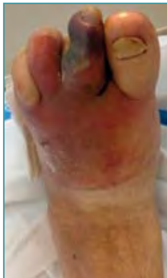
Figura 4. Pie diabético con infección aguda: absceso en el antepié y necrosis en el 2.º dedo.

En las infecciones “leves” o en episodios iniciales, suelen predominar los cocos aerobios Gram-positivos, como Staphylococcus aureus . Las infecciones “graves” o más crónicas suelen ser polimicrobianas, con presencia tanto de gérmenes aerobios como anaerobios, y con un mayor protagonismo de los bacilos Gram-negativos (especialmente, enterobacterias). En infecciones previamente tratadas o recidivantes en contacto con el ámbito hospitalario o sin él, pueden aparecer microorganismos seleccionados multirresistentes