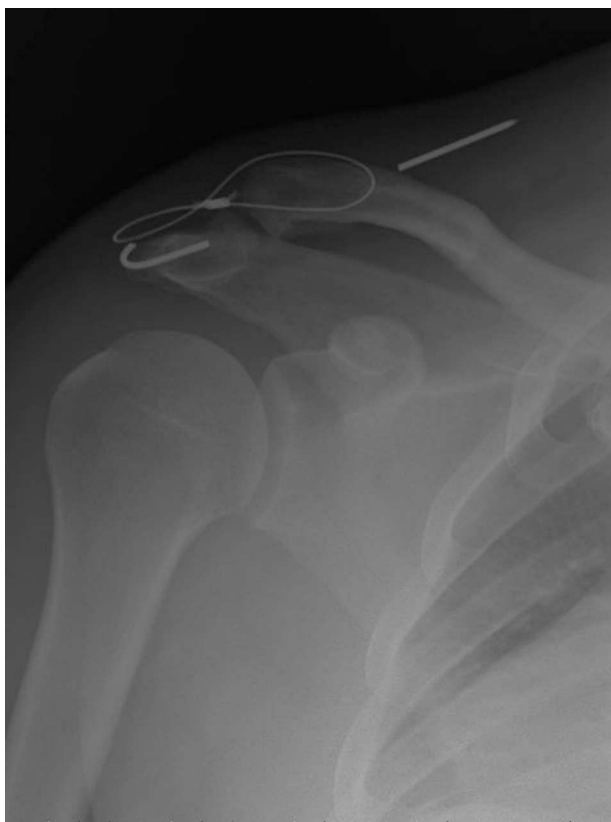
Figura 4 – Complicación tardía tras no extraer totalmente el material.

tratamiento hablan a favor de la cirugía en pacientes jóvenes con demanda laboral física importante o que practiquen deporte 23 , aunque, al no existir estudios prospectivos, aleatorizados de nivel 1 de evidencia, la decisión acerca del tratamiento de las lesiones AC tipo III de Rockwood debería hacerse de forma individualizada, teniendo en consideración factores ya comentados, como la edad, los requerimientos físicos del paciente, el nivel deportivo y el momento de la temporada, en caso de ser deportista. Si la elección fuera el tratamiento conservador, es imprescindible contar con la mayor conformidad del paciente para conseguir un resultado óptimo, lo cual no es fácil en pacientes jóvenes y activos. Si el tratamiento fuera quirúrgico, hay que tener en cuenta la gran cantidad de técnicas disponibles, que serán comentadas en siguientes artículos de este monográfico, los pros y contras de cada una de ellas y las posibles complicaciones descritas (fig. 4).