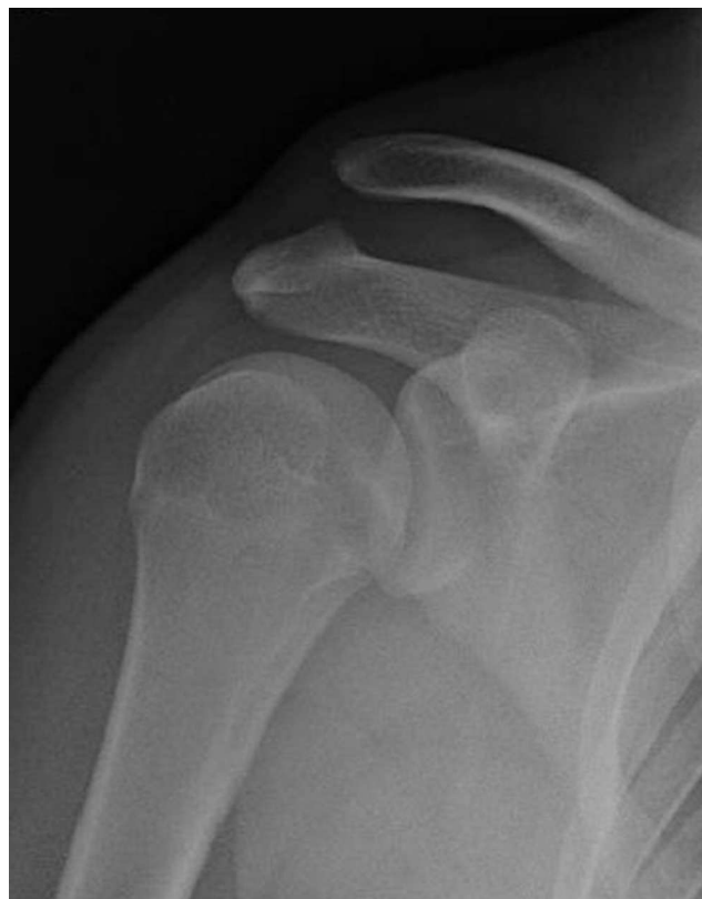
Figura 1 – Luxación acromioclavicular tipo III de Rockwood en el hombro derecho.

A pesar de ser la clasificación más extendida y ampliamente aceptada, ni las formas dinámicas de inestabilidad AC ni las inestabilidades multidireccionales quedan reflejadas,